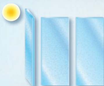
sGG BIOCLEAR – Wirkung 1: Photokatalyse Durch die UV-Strahlen des Tageslichts werden organische Verschmutzungen zersetzt und die Oberfläche wird hydrophil gemacht.

sGG BIOCLEAR ist ausschließlich für Außenanwendungen geeignet, da die hydrophilen und photokatalytischen Eigenschaften nur im ständigen Kontakt mit dem UV-Licht aktiv bleiben. Die besonderen Eigenschaften der sGG BIOCLEAR Beschichtung kommen dabei auch bei indirekter Sonneneinstrahlung und bei bewölktem Himmel zum Tragen.